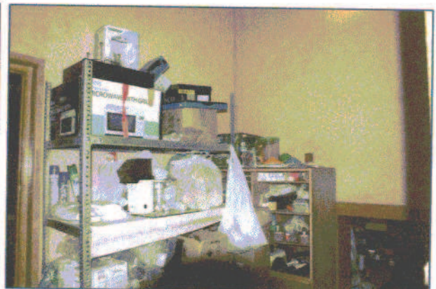
fot.6. Zaplecze gospodarcze świetlicy