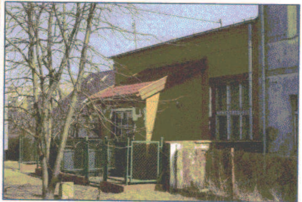
fot.1,2. Widok na budynek świetlicy