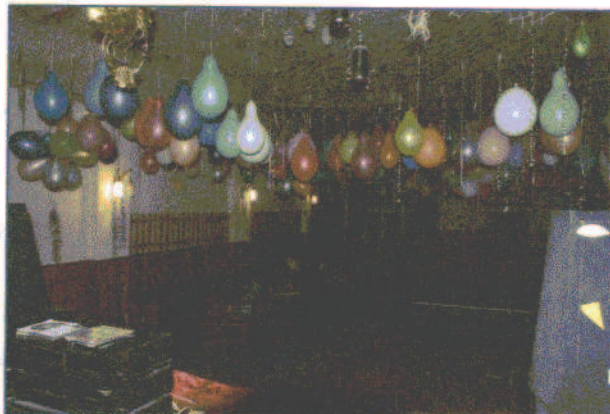
fot.8. Pomieszczenie świetlicy (widok ze sceny)