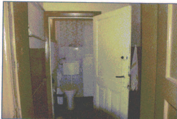
fot.5. Sanitariaty świetlicy