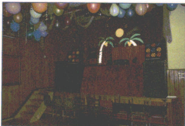
fot.7. Scena świetlicy