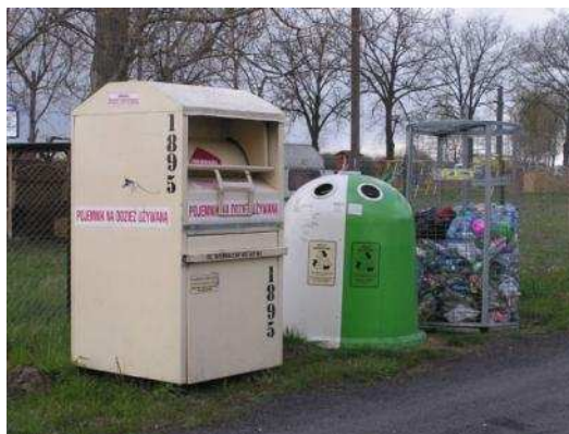
Fot. Podstawowa segregacja śmieci

W miejscowości prowadzona jest selekcja śmieci typu PET i szkło. Odpady składowane są na składowisku śmieci w miejscowości Łęczycza gmina Stara Dąbrowa, przewidywalny okres eksploatacji wysypiska do 2015 r. Na terenie sołectwa, niestety, występują dzikie wysypiska śmieci. Wywozem odpadów z sołectwa Lipnik zajmują się firmy: REMONDIS Sp. z o.o. ze Szczecina oraz MPGK Sp. z o.o. ze Stargardu.