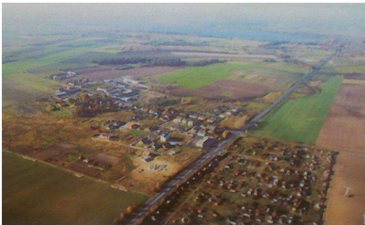
Fot. Lipnik- widok z lotu ptaka

Sąsiaduje również z terenami upraw polowych, w pobliżu terenów, na których lokalizuje się, od strony miejscowości Lipnik zabudowa mieszkaniowa. Północną granicę wyznacza była droga krajowa nr 10 z istniejącą ścieżką rowerową, prowadzącą nad jezioro Miedwie. Po przeciwnej stronie drogi zlokalizowane są miejskie pracownicze ogrody działkowe oraz zainwestowane tereny Stargardzkiego Parku Przemysłowego.