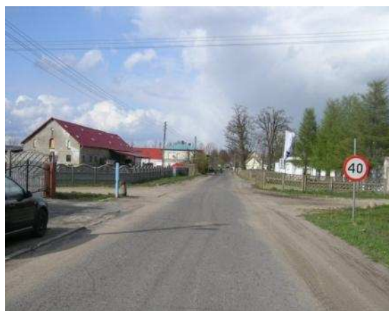
fot. Droga główna w Lipniku