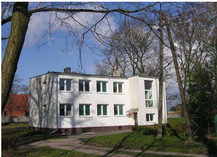
Fot. Lipnik- Bursa wykorzystywana jako świetlica wiejska

Budynek udostępniany przez Zachodniopomorski Uniwersytet Technologiczny pełni funkcje świetlicy.