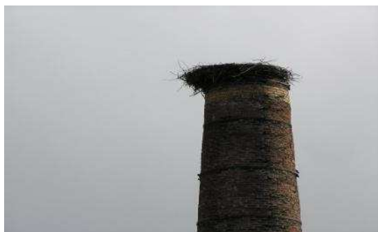
fot. Lipnik- bocianie gniazdo

Krajobraz ulega stopniowym przekształceniom w wyniku urbanizacji tworzącego się pasma funkcjonalnego Szczecin – Stargard Szczeciński. Zabudowano tereny wykorzystywane dotychczas jako tereny upraw polowych.