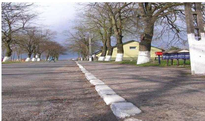
Fot. Lipnik – droga w formie alei liściastej

Kolonia mieszkalna została rozbudowana w latach 20 – tych i 30 – tych XX wieku. Złożona z jednorodnych stylowo dwojaków i trojaków oraz współczesnych bloków mieszkalnych z lat 70 – tych XX wieku. Droga wiejska ma formę kilkudziesięcioletniej alei liściastej.