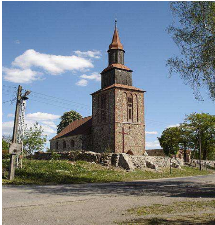
Kościół pw. św. Michała Archanioła w Poczerninie

Około 1,5 km na północny-zachód jest dawny młyn nad Iną z XIX-wieczną zabudową, m.in. dom mieszkalny w konstrukcji ryglowej, obok którego wypływa źródło. Osada położona nad rzeką Iną, po jej wschodniej stronie, w odległości ok. 1 km na południe od niedokończonej przez Niemców autostrady Berlin-Królewiec, w połowie odcinka Szczecin - Chociwel. Zachował się średniowieczny plan ulicówki.