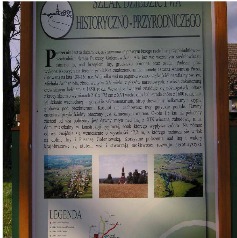
Tablica informacyjna „Szlaku Dziedzictwa Historyczno-Przyrodniczego”