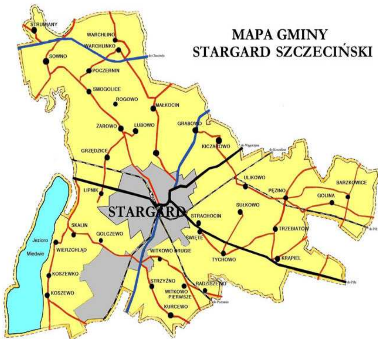
Tab. 1 Wykaz sołectw wchodzących w skład gminy Stargard Szczeciński

Gminę Stargard Szczeciński tworzy 38 miejscowości należących do 30 sołectw, zajmuje powierzchnię 31 908 ha, w tym sołectwo Poczernin 1450,87 ha. W gminie mieszka 11.744 mieszkańców, z czego w sołectwie Poczernin mieszka 220 osób.