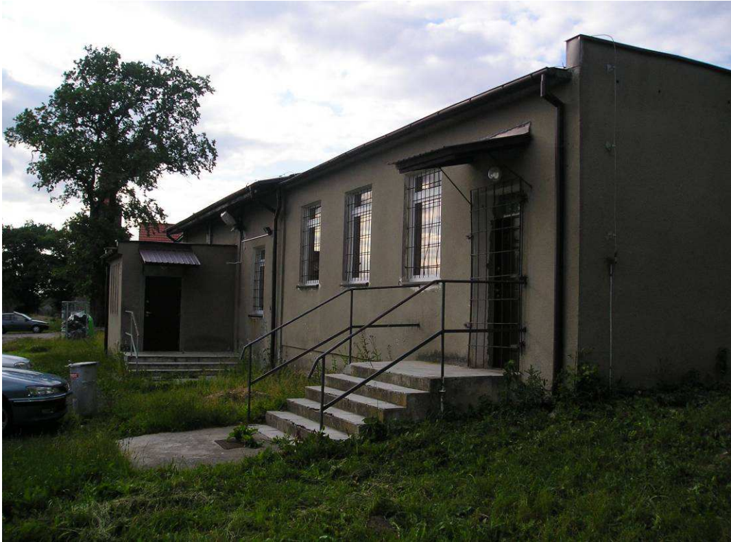
Świetlica wiejska w Poczerninie