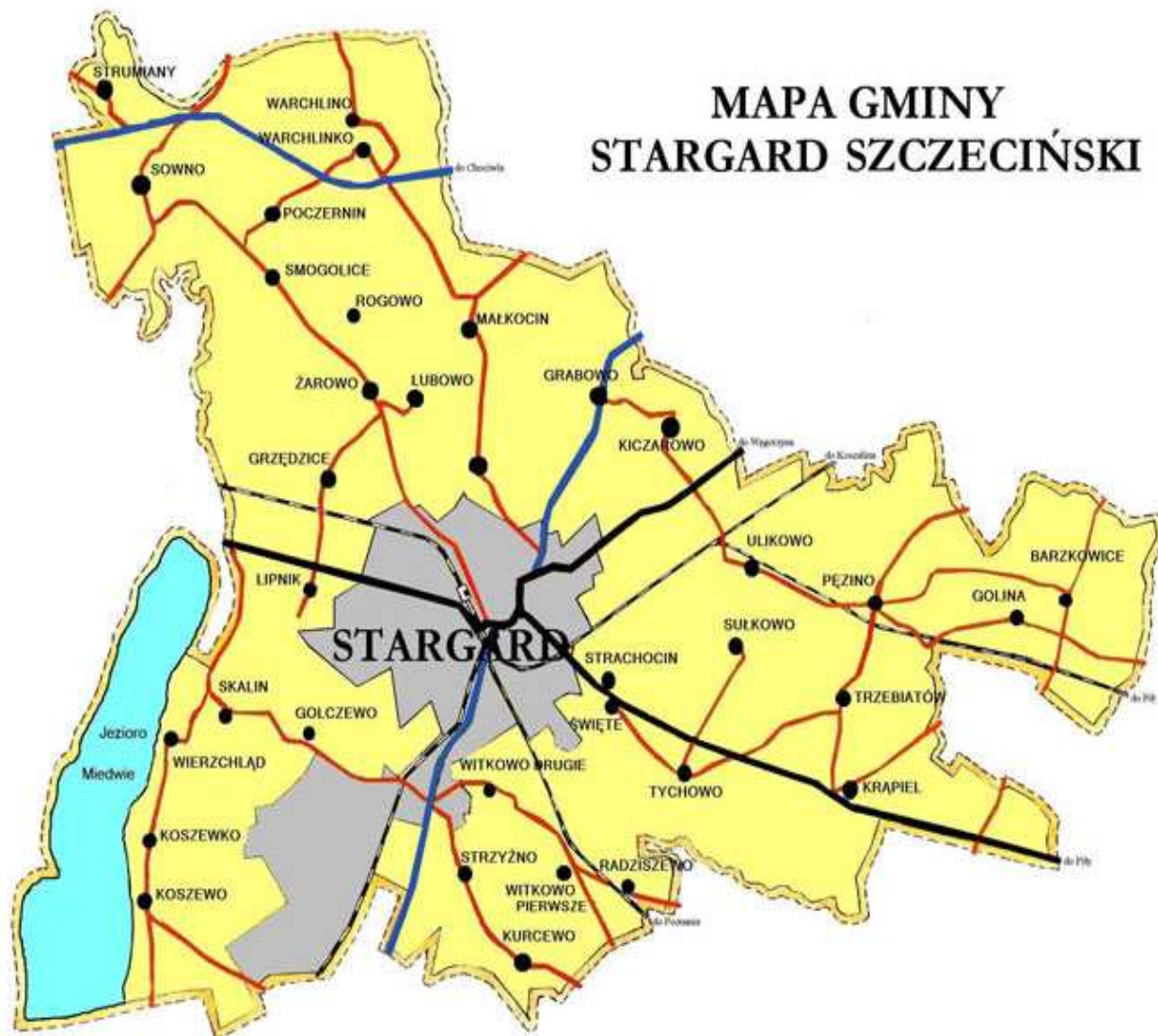
Tab. 1 Wykaz sołectw wchodzących w skład gminy Stargard Szczeciński

Gminę Stargard Szczeciński tworzy 38 miejscowości należących do 30 sołectw. Gmina zajmuje powierzchnię 31 908 ha, w tym sołectwo Warchlino - 1456,82 ha. W gminie mieszka 11 744 mieszkańców, z czego w sołectwie Warchlino 165 osób.