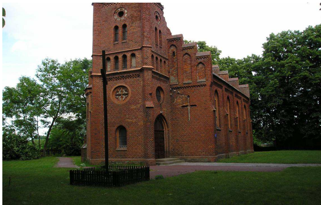
Kościół pw. Chrystusa Króla w Warchlinku

Obiektem, który dominuje tu nad pozostałą zabudową jest ceglany neogotycki kościół z 1897 roku, zbudowany na planie prostokąta z wydzielonym prezbiterium. Od zachodu wieża trzykondygnacyjna, zakończona ośmioboczną ażurową latarnią, zwieńczona hełmem. Szczyty kościelne schodkowe, dekorowane blendami, przy ścianach przypory. We wnętrzu: strop belkowany, ołtarz z obrazem „Ecce homo” (sąd nad Chrystusem), empora chórowa, ławki neogotyckie z XIX wieku, na wieży dzwon. Wieża znajduje się w stanie wymagającym pilnej renowacji. Kościół pw. Chrystusa Króla został poświęcony w 1945 roku. Dzieje Warchlinka wiążą się z Warchlinem. Na przełomie XVI i XVII wieku dzieliło się ono na część szlachecką i książęcą; zarządcami byli zmieniający się dzierżawcy. W 1939 roku cały areal wsi wynosił 213 ha ziemi.