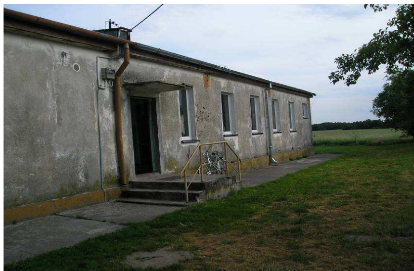
Świetlica wiejska w Warchlinku

Działalność kulturalna wsi prowadzona jest w świetlicy wiejskiej, która wymaga remontu oraz wyposażenia.