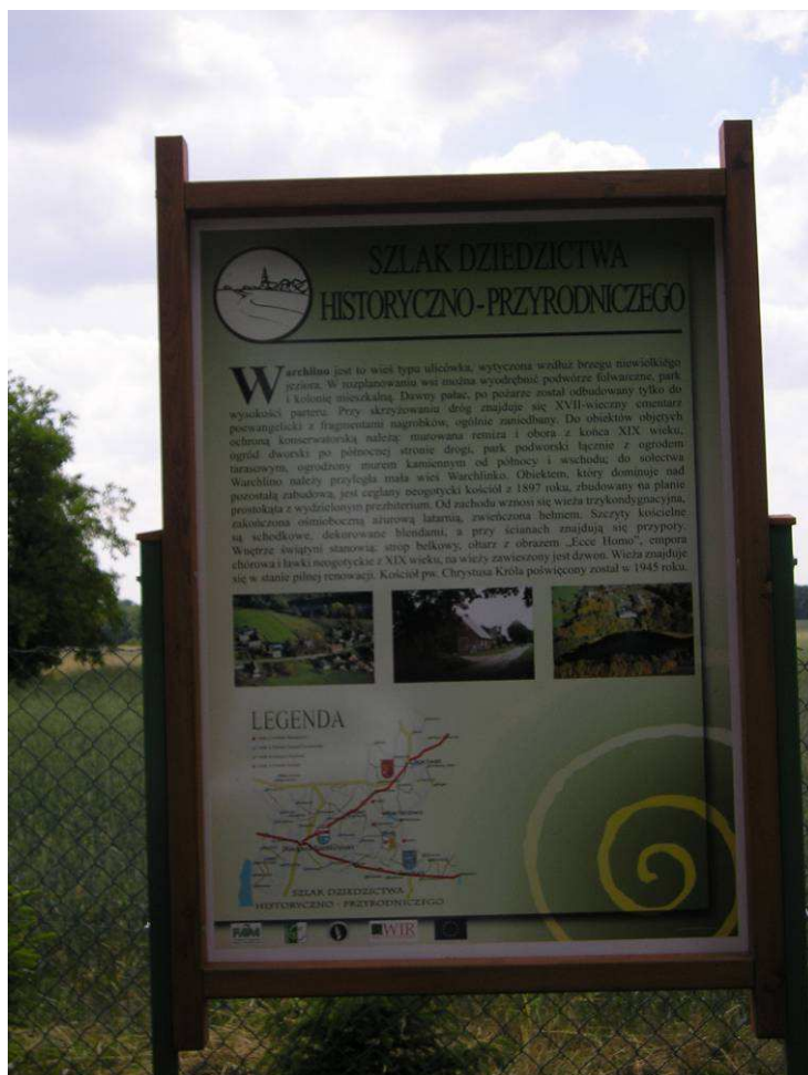
Tablica informacyjna „Szlaku Dziedzictwa Historyczno-Przyrodniczego”