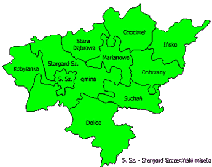
Mapa powiatu Stargardzkiego

Granice administracyjne gminy na przeważającej długości są granicami sztucznymi, jedynie część zachodniej granicy wyznaczona jest zachodnią linią brzegową Jeziora Miedwie, część południowej granicy biegnie wzdłuż koryta Iny, a część granicy północno-wschodniej wzdłuż koryta Małki. Charakterystyczną cechą położenia gminy jest fakt, że w skład jej powierzchni wchodzi część jeziora Miedwie (ok.63 % powierzchni całego jeziora).