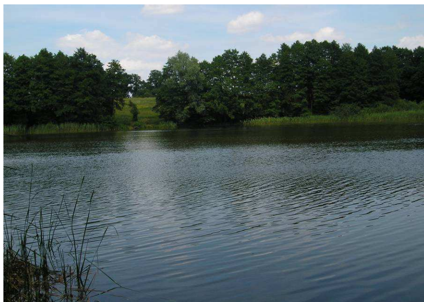
Jezioro w Warchlinie

Dominantą przestrzenną sołectwa Warchlino jest położony na pagórku kościół pw. Chrystusa Króla z jednej strony i jezioro z drugiej strony sołectwa. Układ zabudowy to typowa ulicówka.