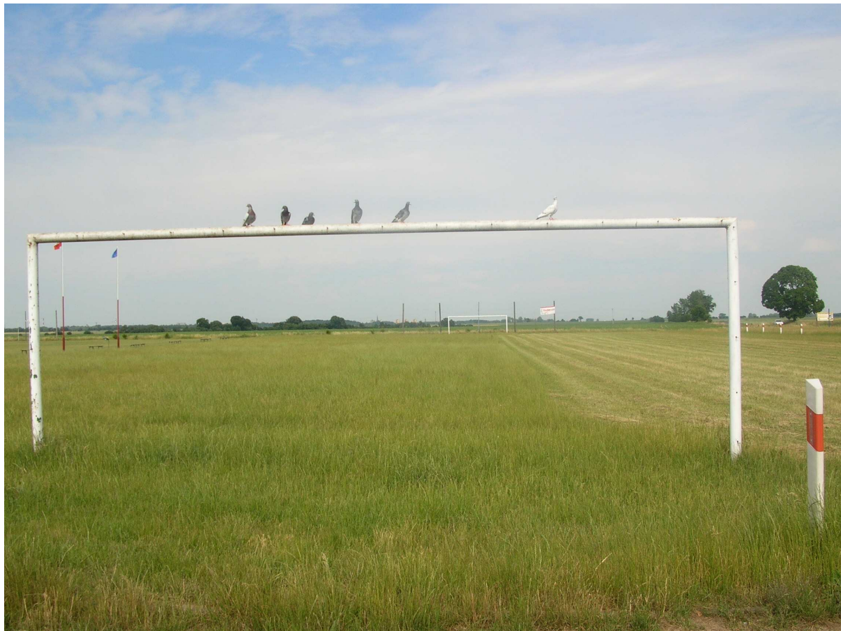
Boisko w Skalinie

Zadanie polegać będzie na budowie szatni sportowej przy istniejącym stadionie. Zadanie powyższe przyczyni się do poprawy dostępności do bazy sportowej, da szansę na stworzenie komfortowego zaplecza dla mieszkańców chcących aktywnie spędzać wolny czas uprawiając sport, pozwoli propagować zdrowy model życia tak wśród dzieci i młodzieży, jak i dorosłych mieszkańców wsi, poprawi aktywność działającego w Skalinie klubu sportowego. Ponadto osiągnięcie celu wpłynie m. in. na zwiększenie atrakcyjności wsi Skalin, wzrost liczby osób uprawiających sport, rozwój młodych talentów sportowych, zwiększenie popularyzacji sportu wśród młodzieży i osób dorosłych oraz poprawę stanu zdrowia i kondycji mieszkańców (w szerszej perspektywie czasowej).