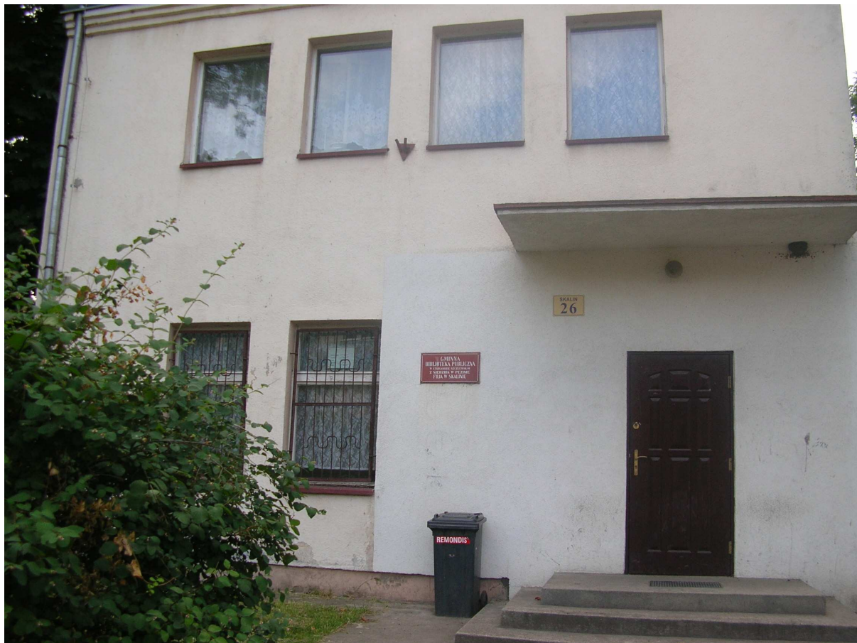
Biblioteka w Skalinie

Celem zadania jest opracowanie dokumentacji projektowej, wyłonienie wykonawcy budowy, zakup materiałów budowlanych i wyposażenia obu budynków w meble, sprzęt techniczny, komputery.