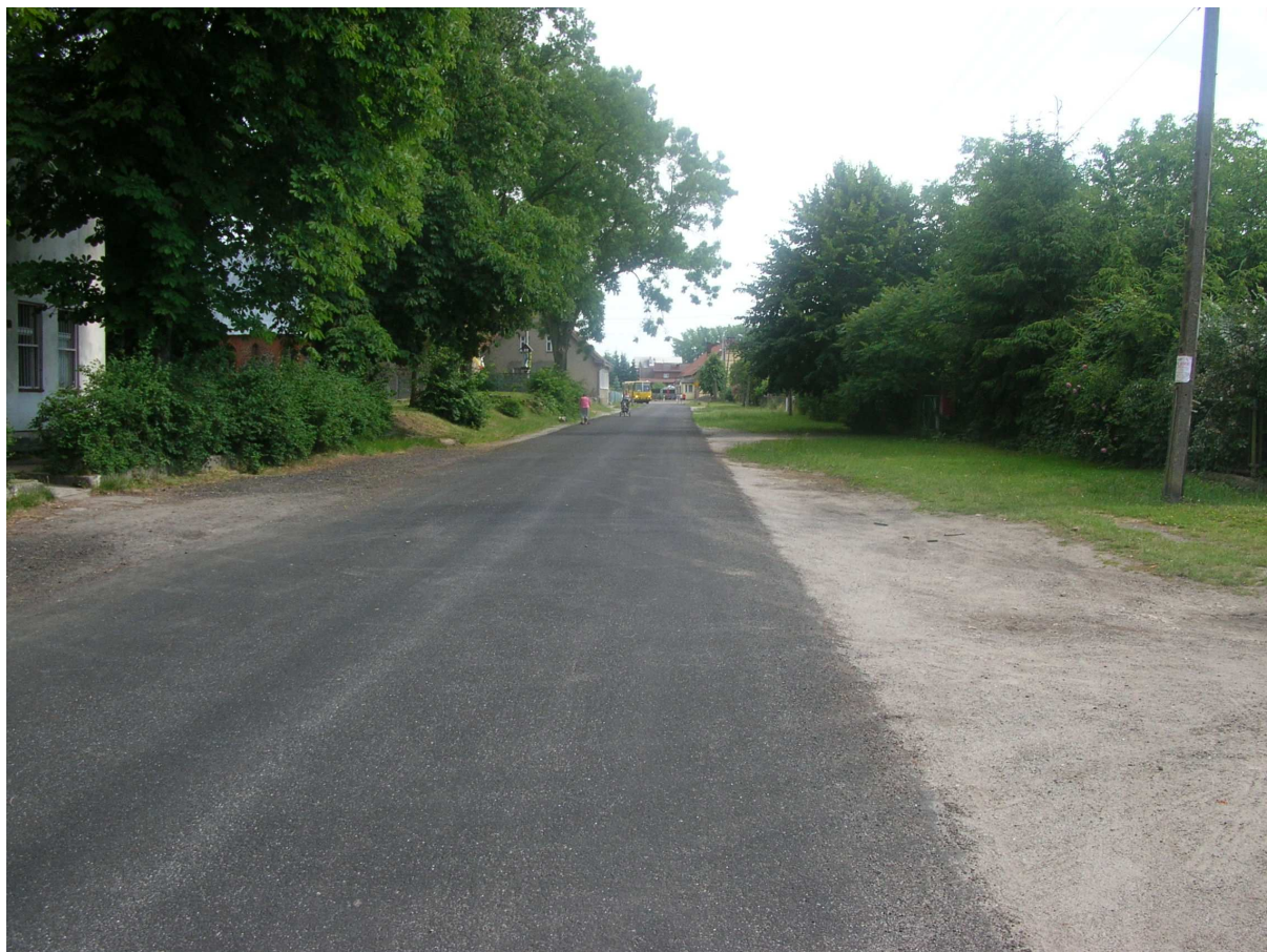
Widok na główną drogę w Skalinie

Celem projektu jest budowa chodników wzdłuż ciągów komunikacyjnych w Skalinie.