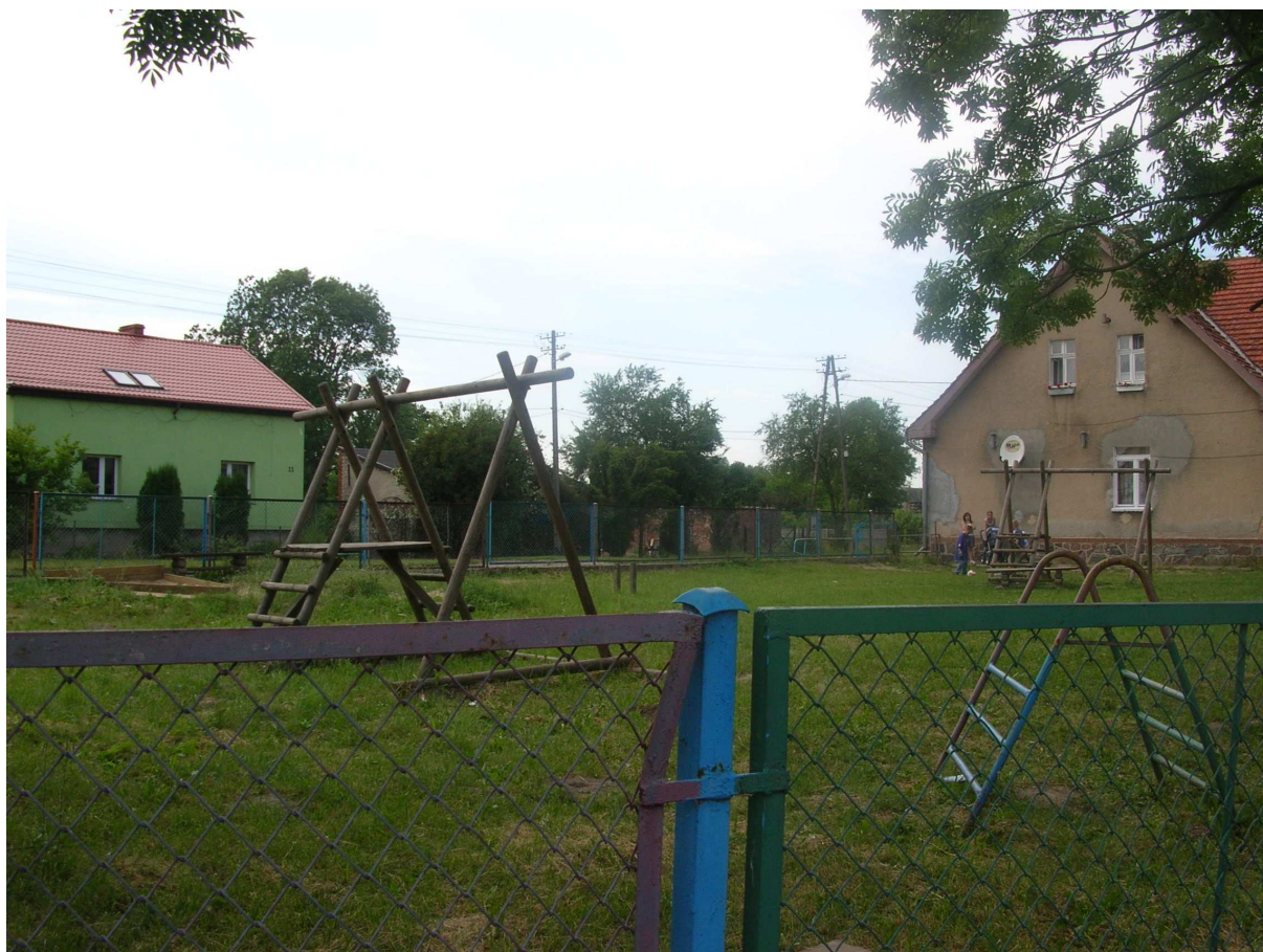
Plac zabaw w Skalinie