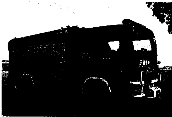
Rys. 2. Ciężki samochód ratowniczo-gaśniczy MAN TGM 18.340 BB podczas zabezpieczenia XXIX Targów Rolnych AGRO POMERANIA w Barzkowicach

Strażacy ochotnicy są wyposażeni w mundury koszarowe, obuwie, hełmy i ubrania specjalistyczne - 9 szt., kombinezon chroniący przed szerszeniami - 2 szt., 8 aparatów powietrznych oraz sprzęt ratownictwa medycznego i ratownictwa drogowego zakupiony z dotacji Komendy Głównej PSP.