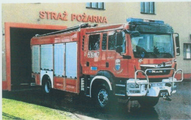
Rys. 2. Ciężki samochód ratowniczo-gaśniczy MAN TGM 18.340 BB będący na wyposażeniu OSP Żarowo.