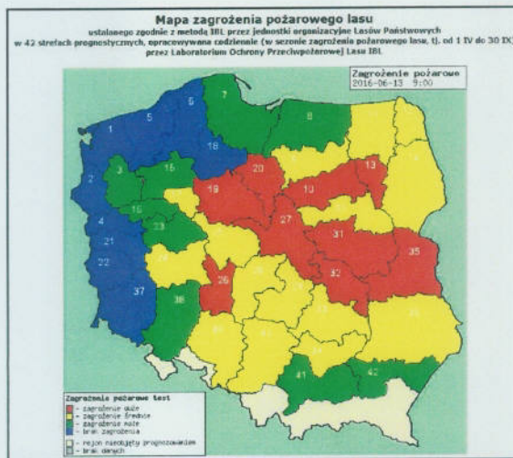
Rys. 1. Przykładowa mapa zagrożenia pożarowego lasów. Gmina Stargard znajduje się w 3 strefie prognostycznej.

Tereny gminy pokryte są licznymi kompleksami leśnymi. Powierzchnia lasów i zalesień wynosi około 9 257 ha co stanowi około 29% ogólnej powierzchni gminy.